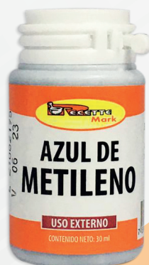
Cód: 1053 Azul de Metileno 30 cc