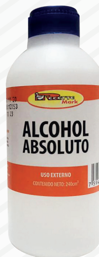
Cód: 1038 Alcohol Absoluto 240 cc