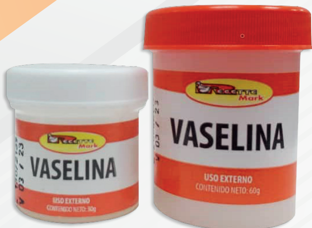
Cód: 1222 (30 ml) / Cód: 1223 (60 ml) Vaselina 30 g / 60 g