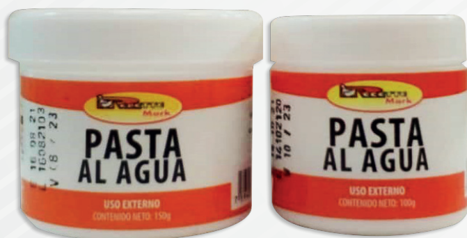
Cód: 1150 (30 ml) / Cód: 1149 (60 ml) Pasta al Agua 150 g / 100 g