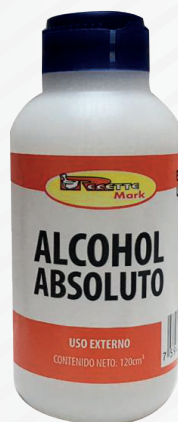
Cód: 1037 Alcohol Absoluto 120 cc