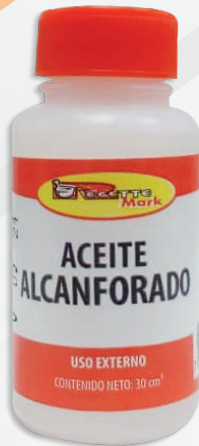
Cód: 1001 Aceite Alcanforado 30 cc