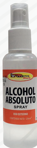
Cód: S1037 (120 ml) Cód: S1038 (240 ml) Alcohol Absoluto Spray 120 / 240 cc