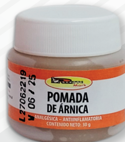
Cód: 1157 (30 ml) / Cód: 1158 (60 ml) Pomada de Árnica 30 g / 60 g