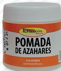
Cód: 1159 (30 ml) / Cód: 1160 (60 ml) Pomada de Azahares 30 g / 60 g