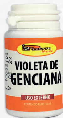
Cód: 1225 Violeta de Genciana 30 cc