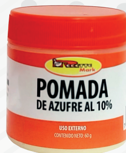
Cód: 1161 (30 ml) / Cód: 1162 (60 ml) Pomada de Azufre al 10% 30 g / 60 g - Cura la escabiosis. - Limpia la dermis. - Reduce el acné.