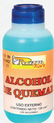
Cód: 1040 Alcohol de Quemar 120 cc