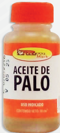
Cód: 1013 Aceite de Palo 30 cc