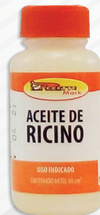
Cód: 1016 Aceite de Ricino 30 cc