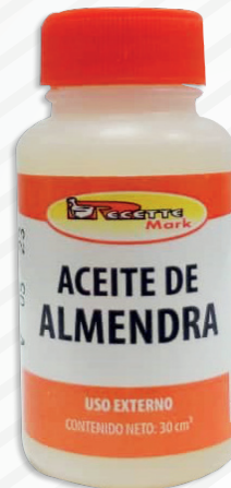
Cód: 1003 Aceite de Almendras 30 cc