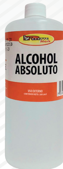
Cód: 3183 Alcohol Absoluto 500 cc